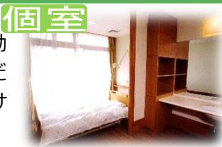
ベッド側に大きな窓があり、日当たり抜群です!

扇の森には個室の他にも、多床室（2人・4人・夫婦部屋）がございます。タンズや電動ベッドは備えつけの為、改めてご準備いただくことなく安心した環境でお過ごしいただけます。もちろん、TVや日用品など慣れ親しんだ物のお持込も可能です。各階には面会スペースがあり、気軽にご面会いただけます。