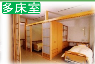
個室のように仕切られたプライベート空間!